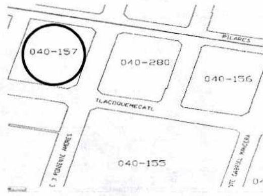
Ubicación exacta del inmueble