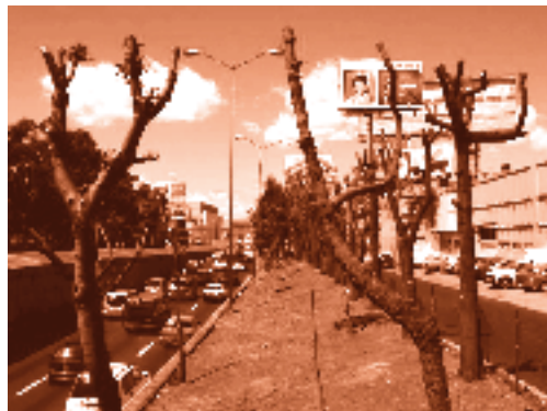
Poda sobre el camellón del Viaducto Presidente Miguel Alemán

Este caso propició la emisión de un resolutive a la Dirección General del Fideicomiso para el Mejoramiento de las Vías de Comunicación del Distrito Federal (Fimevic), mediante el cual se solicitaba el cumplimiento de las condiciones establecidas en la autorización de impacto ambiental emitida por la Secretaría del Medio Ambiente y la recuperación del