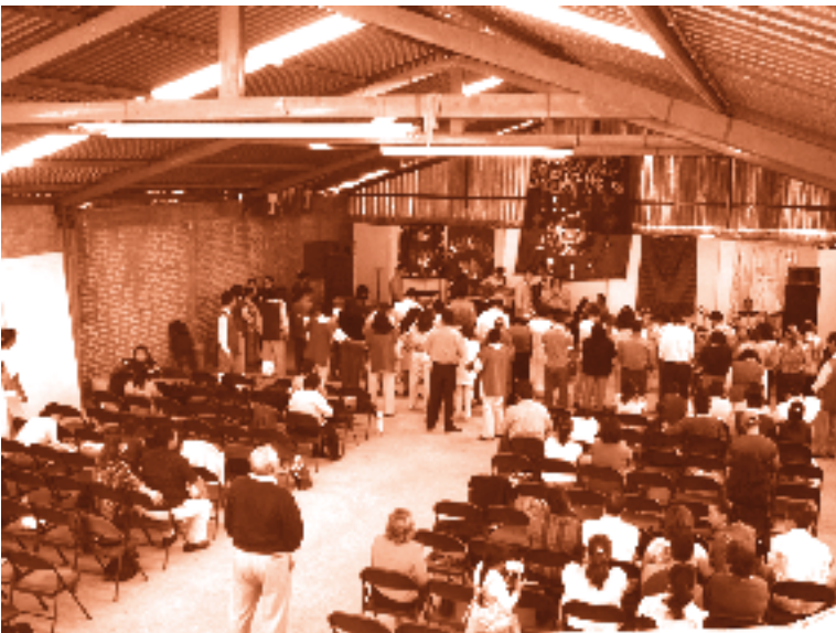
Ruido generado por una asociación religiosa

En esta investigación se comprobó que el establecimiento mercantil de electro-acabados en aluminio ocasionaba ruido excesivo con maquinaria de procesos industriales, calderas y torres de enfriamiento; durante el desarrollo de la investigación se atendió la emisión de contaminantes a la atmósfera y descarga de aguas residuales, además del legal funcionamiento del establecimiento respecto al uso de suelo. Durante la investigación la delegación clausuró el establecimiento por irregularidades en materia de uso del suelo, aún cuando se habían iniciado medidas de mitigación para eliminar el ruido y las emisiones a la atmósfera.