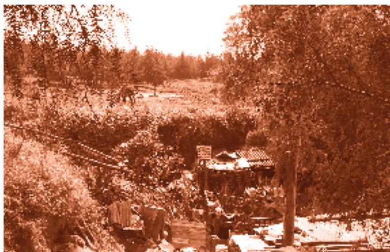
Loma Encantada, Delegación Iztapalapa