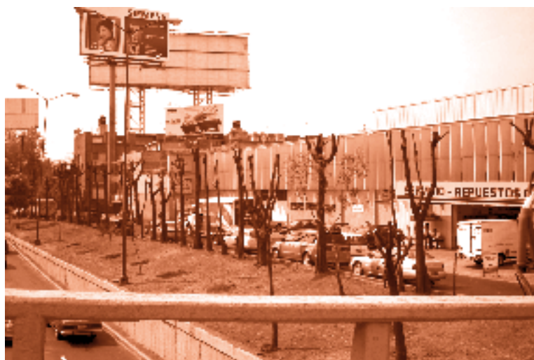
Poda excesiva de 50 árboles

En cuanto a solicitudes de trasplantes, se ha instado a las autoridades delegacionales a que se cercioren de que sean utilizadas las