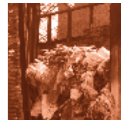
Manejo inadecuado de residuos sólidos

excretas de animales, entre otros. Al respecto, se gestionó el adecuado mantenimiento y limpieza del sistema de drenaje en el área de influencia en los sitios de las denuncias.