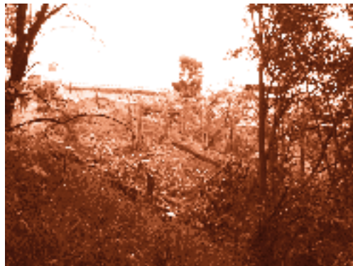
Barranca de Bezares, Delegación Miguel Hidalgo

De hecho, con la emisión del dictamen técnico ambiental por parte de la PAOT, en el que se describen los daños y se proponen las acciones de restauración, así como con la intervención de la Secretaría del Medio Am-