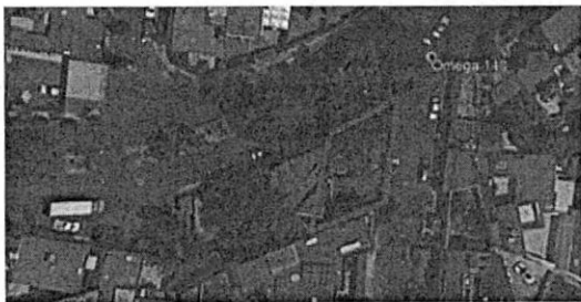
24 DE ENERO DE 2020 GOOGLE EARTH