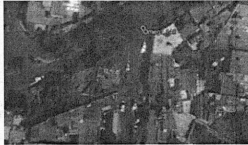
27 DE MARZO DE 2020 GOOGLE EARTH