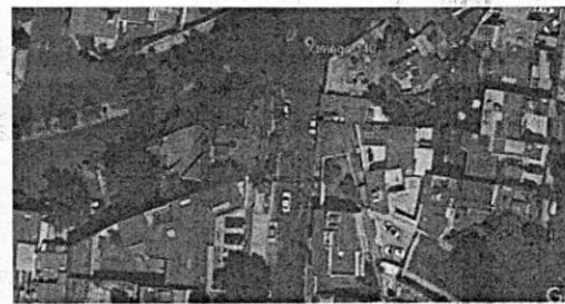
24 DE MARZO DE 2018 GOOGLE EARTH