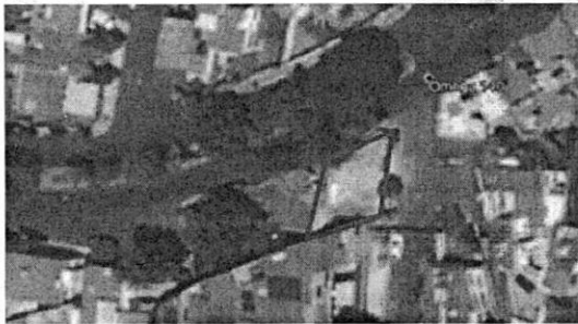
22 DE SEPTIEMBRE DE 2020 GOOGLE EARTH