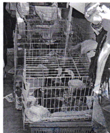
Figuras 1 y 2. Vista de los ejemplares felinos en adopción.

Aunado a lo anterior, durante dichos recorridos se hizo del conocimiento de las personas responsables de los animales la legislación vigente en materia de protección animal, de manera particular la prohibición de vender