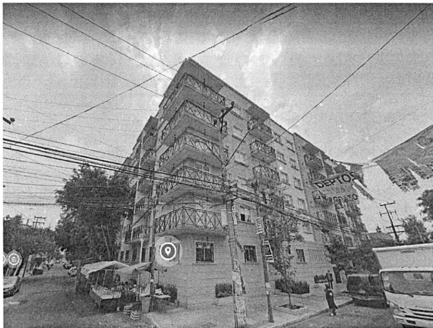
Imagen de fecha de abril de 2021

En este sentido, es importante señalar que de las documentales que obran en el expediente se tiene conocimiento que las actividades de construcción contaron con registro de la Manifestación de Construcción Tipo "B" número RITZ-0018-13, con vigencia del 26 de julio de 2013 al 26 de julio de 2016 y Prórroga del Registro de Manifestación de Construcción número 15-02-2016-08, con vigencia del 06 de julio de 2016 al 06 de julio de 2019, para la construcción de 81 viviendas en 6 niveles, en una superficie total de construcción de 7,245.31 m 2 de los cuales 1,751.75 m 2 corresponden a semisótano (no cuantificable), área libre de 293.04 m 2 (21.04%) al amparo del Certificado Único de Zonificación de Uso del Suelo folio 2837-151CLRO13 de fecha 06 de febrero de 2013. -----