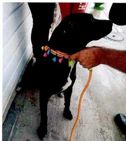
Figuras 3 y 4. Ejemplar canino que responde al nombre de "Sombra".

Derivado de lo antes referido, personal de esta Entidad tuvo conocimiento de que la persona adoptante, ha proporcionado el tratamiento médico para atender el problema de la piel que el canino presentaba.