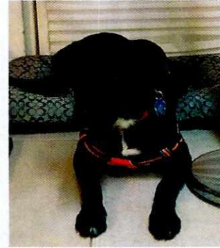
Figuras 5 y 6. Ejemplar canino que responde al nombre de "Sombra".

En virtud de lo antes expuesto, esta Entidad considera procedente emitir la presente resolución, de conformidad con el artículo 27 fracción VII de la Ley Orgánica de esta Procuraduría, por el cumplimiento voluntario de las disposiciones jurídicas en materia de bienestar animal.