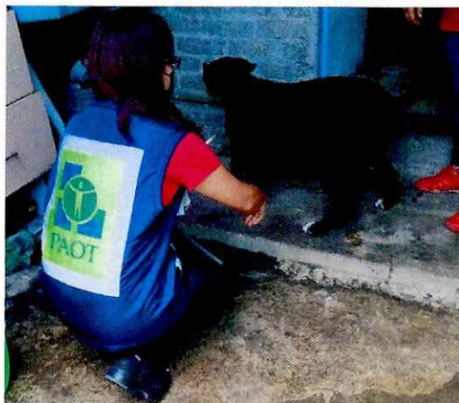
Figuras 1 y 2. Ejemplares motivo de denuncia.

En seguimiento de lo anterior, personal de esta Entidad en coordinación con personal de la Brigada de Vigilancia Animal (BVA) de la Secretaría de Seguridad Ciudadana (SSC) llevaron a cabo una nueva visita de reconocimiento de hechos, con la finalidad de dar seguimiento a las recomendaciones antes mencionadas, constatando que no fueron atendidas; por lo anterior, mediante la promoción del cumplimiento voluntario de las disposiciones en materia de bienestar animal, facultad conferida a esta Entidad en el artículo 5 fracción XIX de la Ley Orgánica de esta Procuraduría, es que la persona responsable de los animales, hizo entrega de manera voluntaria del ejemplar de nombre "Sombra", a una protectora independiente, quien actualmente brinda las condiciones de bienestar necesarias.