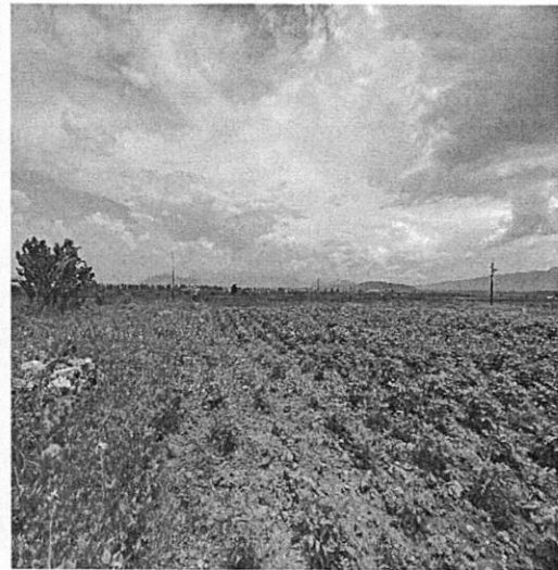
Imagen 1, 2 y 3. Localización y registro fotográfico de visita de reconocimiento de hechos en el predio objeto de denuncia.