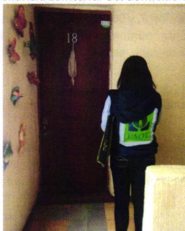
Figura 1. Lugar de los hechos denunciados.

artículo 15 BIS 4 fracción IV de la Ley Orgánica de esta Entidad, diligencia durante la cual una persona habitante del lugar donde se denunciaron los hechos objeto de la presente investigación, hizo de conocimiento al personal adscrito a esta Subprocuraduría que el ejemplar canino que fue señalado en el escrito de la denuncia, ya no se encuentra en el inmueble, lo anterior toda vez que fue reubicado al domicilio de un familiar. Cabe señalar que el personal de la PAOT constató que efectivamente no había algún ejemplar con las características descritas en la denuncia al interior del domicilio en cuestión.