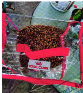
Figuras 2, 3 y 4. Ejemplar canino denunciado, del recipiente con agua y su alimento.