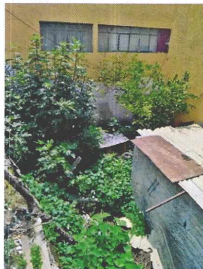
Figura 1. Lugar de los hechos denunciados.

En seguimiento de lo anterior, personal de esta Subprocuraduría informó a la persona denunciante que durante visita de reconocimiento de hechos no se constató la presencia del ejemplar canino en el sitio señalado en su denuncia, por lo que los hechos que motivaron su denuncia dejaron de existir.