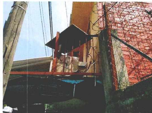
Figura 1. Lugar de los hechos denunciados.

En seguimiento de lo anterior, personal de esta Subprocuraduría informó a la persona denunciante que durante visita de reconocimiento de hechos no se constató la presencia del ejemplar canino en el sitio señalado en su denuncia, quien a su vez indicó que efectivamente el perro fue adoptado por un vecino del lugar, por lo que los hechos que motivaron su denuncia dejaron de existir.