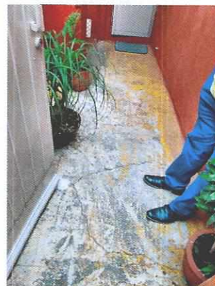
Figura 1 y 2. Lugar de los hechos denunciados, no se observa algún ejemplar canino.

En seguimiento de lo anterior, personal de esta Subprocuraduría informó a la persona denunciante que durante visita de reconocimiento de hechos no se constató la presencia del ejemplar canino en el sitio señalado en su denuncia, por lo que los hechos que motivaron su denuncia dejaron de existir.