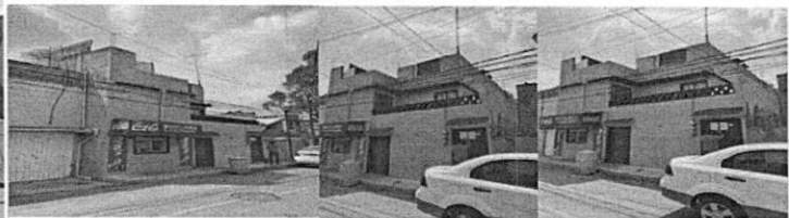
Fotografías tomadas por Personal Adscrito a la Subprocuraduría en Reconocimiento de Hechos, fecha 05 de Abril de 2022.