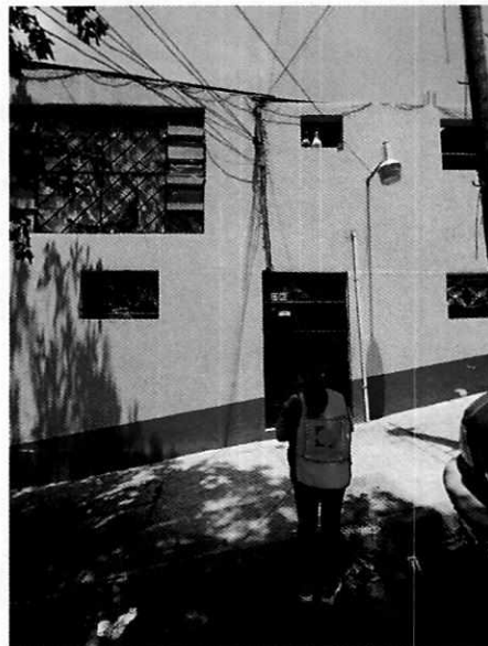
Figura 1. Fachada del domicilio donde se presentan los hechos denunciados.

En este sentido, de las constancias que obran en el presente expediente, se desprende que personal de esta Subprocuraduría llevó a cabo una visita de reconocimiento de hechos, de acuerdo a lo establecido en el artículo 15 BIS 4 fracción IV de la Ley Orgánica de esta Entidad, diligencia durante la cual una persona habitante del lugar donde se denunciaron los hechos objeto de la presente investigación, hizo de conocimiento al personal adscrito a esta Subprocuraduría que el ejemplar canino que fue señalado en el escrito de la denuncia, ya no se encuentran en el inmueble, lo anterior toda vez que el propietario del ejemplar canino se cambió de domicilio, llevándose consigo al perro. Cabe señalar que el personal de la PAOT constató que efectivamente no había algún ejemplar con las características descritas en la denuncia al interior del domicilio en cuestión.