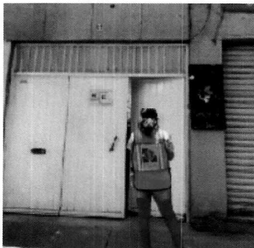
Figura 1. Lugar de los hechos denunciados.

En este sentido, de las constancias que obran en el presente expediente, se desprende que personal de esta Subprocuraduría llevó a cabo una visita de reconocimiento de hechos, de acuerdo a lo establecido en el artículo 15 BIS 4 fracción IV de la Ley Orgánica de esta Entidad, diligencia durante la cual una persona habitante del lugar donde se denunciaron los hechos objeto de la presente investigación, hizo de conocimiento al personal adscrito a esta Subprocuraduría que el ejemplar canino que fue señalado en el escrito de la denuncia había muerto sin conocer el motivo; en el mismo acto la persona que atendió la diligencia mencionó que el canino fue cremado. Cabe señalar que el personal de la PAOT constató que efectivamente no había algún ejemplar con las características descritas en la denuncia al interior del domicilio en cuestión.