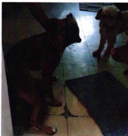
Figura 1. Ejemplares denunciados.

Es de resaltar que, en el Acuerdo de Admisión, que fue enviado por correo electrónico a la persona denunciante, se le hizo de conocimiento que contaba con un término de seis días hábiles para aportar las pruebas que estimara pertinentes en la investigación de los hechos, lo anterior conforme al artículo 90 del Reglamento de la Ley Orgánica de la Procuraduría Ambiental y del Ordenamiento Territorial de la Ciudad de