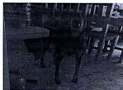
Imágenes 1 y 2. Ejemplar canino señalado en el escrito de denuncia.