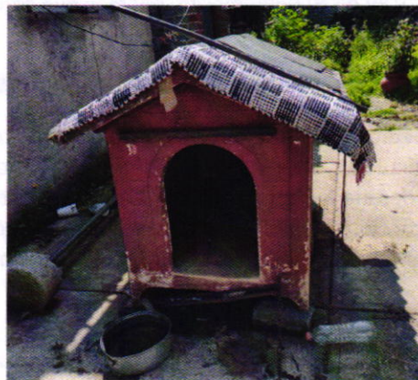
Figuras 1 y 2. Ejemplar denunciado y su sitio de alojamiento.

Es de resaltar que, en el Acuerdo de Admisión, que fue enviado por correo electrónico a la persona denunciante, se le hizo de conocimiento que contaba con un término de seis días hábiles para aportar las pruebas que estimara pertinentes en la investigación de los hechos, lo anterior conforme al artículo 90 del Reglamento de la Ley Orgánica de la Procuraduría Ambiental y del Ordenamiento Territorial de la Ciudad de México; sin embargo durante el procedimiento de investigación, no fueron proporcionados elementos de prueba que pudieran determinar incumplimiento a la normatividad en materia de bienestar animal.