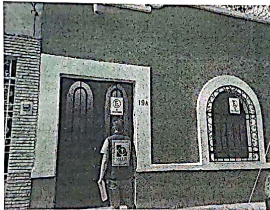
Fotografía 1: Fachada y número oficial del sitio señalado en la denuncia.

En este sentido, de las constancias que obran en el presente expediente, se desprende que personal de esta Subprocuraduría llevó a cabo una visita de reconocimiento de hechos, de acuerdo a lo establecido en el artículo 15 BIS 4 fracción IV de la Ley Orgánica de esta Entidad, diligencia durante la cual el propietario del ejemplar canino, hizo de conocimiento al personal adscrito a esta Subprocuraduría que el ejemplar señalado en el escrito de la denuncia tiene más de dos meses que no se encuentra en el inmueble. Cabe señalar que no se percibió ningún indicio (ladrido u olores) que indique la presencia de algún ejemplar canino al interior del inmueble