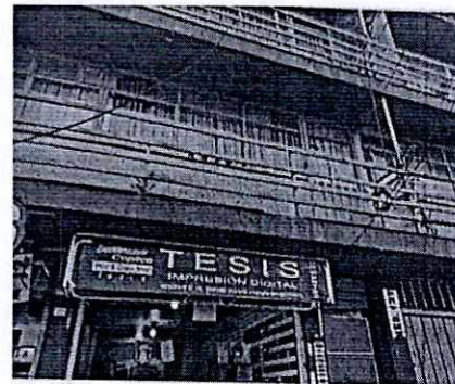
Imagen 1. Y 2. Exterior del inmueble señalado.

Es de resaltar que, con la finalidad de contar con elementos adicionales respecto de los hechos denunciados y así poder ubicar con precisión el domicilio en donde ocurren los hechos motivo de investigación, en el Acuerdo de Admisión, que fue enviado por correo electrónico a la persona denunciante, se le hizo de conocimiento que contaba con un término de seis días hábiles para aportar las pruebas que estimara pertinentes en la investigación de los hechos, lo anterior conforme al artículo 90 del Reglamento de la Ley Orgánica de la Procuraduría Ambiental y del Ordenamiento Territorial de la Ciudad de México; sin embargo durante el procedimiento de investigación, no fueron proporcionados elementos de prueba que pudieran determinar incumplimiento a la normatividad en materia de bienestar animal.