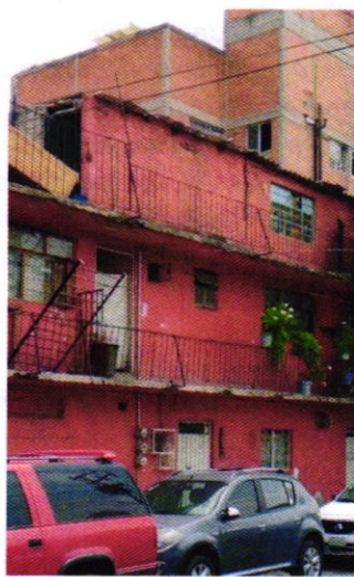
Figuras 1 y 2. Lugar de los hechos denunciados.

En seguimiento de lo anterior, personal de esta Subprocuraduría llevó a cabo una nueva visita de reconocimiento de hechos durante la cual desde el espacio público no se constató la existencia del ejemplar canino motivo de denuncia, ladridos provenientes del interior de la vivienda de referencia u olores característicos de la presencia del animal de compañía.