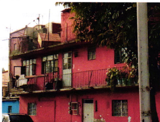
Figura 3. Lugar de los hechos denunciados.

No. Folio: PAOT-05-300/200- 1 2 5 5 5 -2021