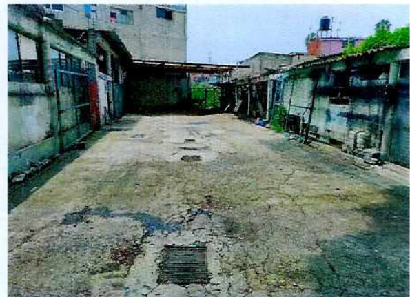
Fotografía 1-2. Inmueble de los hechos denunciados

En seguimiento de lo anterior, personal de esta Subprocuraduría informó a la persona denunciante que durante visita de reconocimiento de hechos no se constató la presencia de los ejemplares caninos en el sitio señalado en su denuncia, por lo que los hechos que motivaron su denuncia dejaron de existir.