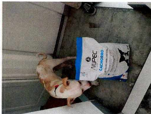
Figuras 1 y 2. Ejemplar denunciado y su bulto de croquetas.

Es de resaltar que, en el Acuerdo de Admisión, que fue enviado por correo electrónico a la persona denunciante, se le hizo de conocimiento que contaba con un término de seis días hábiles para aportar las pruebas que estimara pertinentes en la investigación de los hechos, lo anterior conforme al artículo 90 del Reglamento de la Ley Orgánica de la Procuraduría Ambiental y del Ordenamiento Territorial de la Ciudad de México; sin embargo durante el procedimiento de investigación, no fueron proporcionados elementos de prueba que pudieran determinar incumplimiento a la normatividad en materia de bienestar animal.