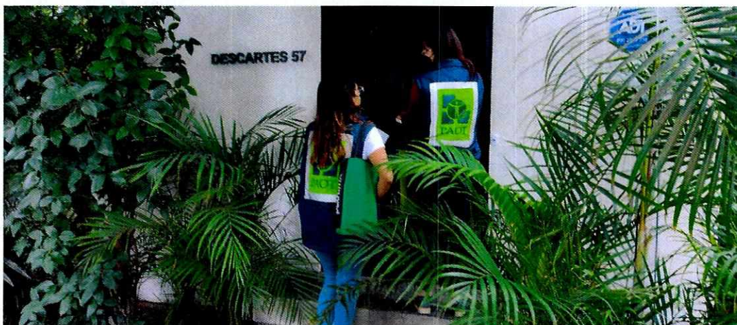
Figura 1. Vista del sitio referido en el escrito de denuncia.

puerta del inmueble sin que atendieran al personal de esta Entidad, asimismo desde el espacio público no se constató la existencia de algún ejemplar canino; no obstante se dejó oficio mediante instructivo fijado en la puerta; por lo que en días posteriores el propietario del canino se comunicó con personal de esta Procuraduría, con el fin de permitir el acceso a su domicilio.