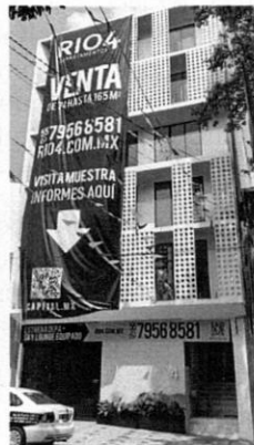
Reconocimiento de hechos 07 de marzo de 2022. Se observa una edificación de 6 niveles de altura completamente edificada.