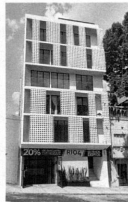
Reconocimiento de hechos 26 de julio de 2022. Se observa una edificación de 6 niveles de altura completamente edificada.