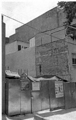
Google Maps-Street View. Julio 2019. Se observa un predio delimitado con tapiales metálicos.