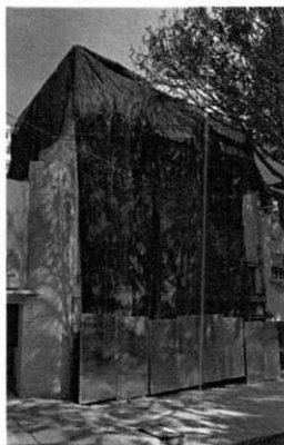
Diciembre 2018. Se observa un inmueble cubierto en su totalidad con malla sombra.

Dicho lo anterior a efecto de allegarse de mayores elementos, de la consulta realizada al programa electrónico Google Maps con ayuda de su herramienta Street View y los reconocimientos de hechos realizados por personal adscrito a esta Entidad, se realizó un estudio multitemporal en el cual se desprende que, del año 2018 al año 2022 en el predio objeto de investigación se ejecutó la demolición total de un inmueble preexistente y el proyecto de obra nueva de una edificación de 6 niveles, como lo muestran las imágenes que a continuación se anexan. --