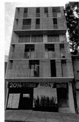
Reconocimiento de hechos 29 de julio de 2022. Se observa una edificación de 6 niveles de altura completamente edificada con sellos de clausura en planta baja.

Al respecto, de las gestiones realizadas por esta Entidad, la Dirección de Patrimonio Cultural Urbano y Espacio Público de la Secretaría de Desarrollo Urbano y Vivienda de la Ciudad de México, informó mediante oficio SEDUVI/DGOU/DPCUEP/1373/2022 de fecha 13 de mayo de 2022, que cuenta con una denuncia ciudadana, además menciona que en los archivos de esa Dirección no se registran antecedentes de emisión del Registro de Intervenciones Mayores, Dictamen Técnico o Visto Bueno que acredite los trabajos de demolición y obra nueva; por lo que en fecha 05 de marzo de 2020, esa Dirección informó a la Alcaldía Cuauhtémoc sobre dicha denuncia ciudadana y la inexistencia de antecedentes documentales para la intervención en Área de Conservación Patrimonial; quien le refirió que Personal Especializado en Funciones de Verificación Administrativa del Instituto de Verificación Administrativa de la Ciudad de México, asignado a la Alcaldía Cuauhtémoc, ejecutó visita de Verificación Administrativa en materia de construcción AC/DGG/SVR/OVO/544/2020. -----