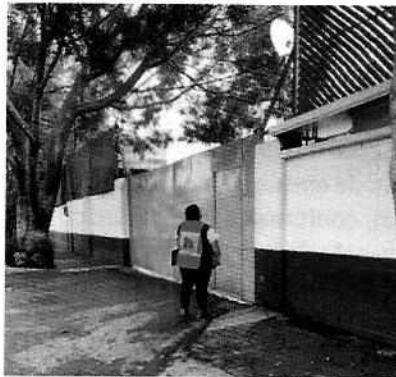
Figura 4. Se observa fachada del Centro de Distribución motivo de investigación.

En este sentido, de las constancias que obran en el presente expediente, se desprende que personal de esta Subprocuraduría llevó a cabo una visita de reconocimiento de hechos, de acuerdo a lo establecido en el artículo 15 BIS 4 fracción IV de la Ley Orgánica de esta Entidad, diligencia durante la cual se constató que, por lo que hace a las emisiones sonoras, se percibieron emisiones sonoras, sólo del encendido de motor de los camiones de distribución.