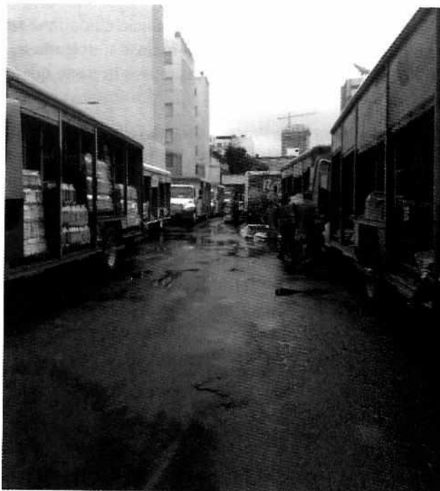
Figura 1. Se observa interior del Centro de Distribución motivo de investigación.

Durante la diligencia mencionada anteriormente, se llevó a cabo la notificación del citatorio PAOT-05-300/200-3650-2021, en el que se le requirió a la empresa citada, que remitiera a esta Procuraduría el Certificado de Uso de Suelo con el que acreditara uso ejercido en el predio objeto de denuncia. Al respecto, el apoderado legal de la persona moral "Embotelladora Mexicana, S.A. de C.V.", remitió a esta Entidad Certificado de Zonificación para Uso de Suelo Específico folio 41212-182ALGR09 de fecha de expedición 24 de julio de 2009, en donde el uso para bodega con o sin refrigeración de productos perecederos sin venta al público se encuentra permitido.