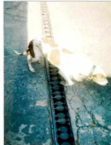
Figura 2. Evidencia de las recomendaciones realizadas por el propietario.

En virtud de lo antes expuesto, esta Entidad considera procedente emitir la presente resolución, de conformidad con el artículo 27 fracción VII de la Ley Orgánica de esta Procuraduría, por el cumplimiento voluntario de las disposiciones jurídicas en materia de bienestar animal.