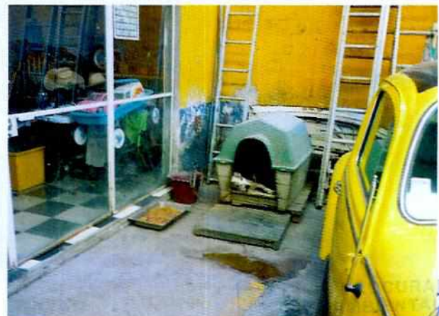
Imagen 1 y 2. Ejemplares denunciados y su alojamiento.