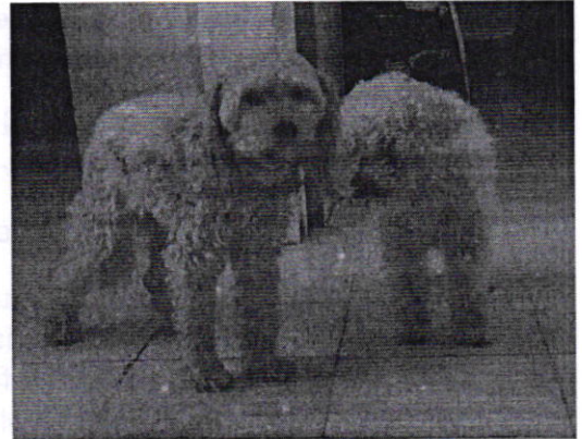
Figuras 1 a 3. Ejemplares caninos que responden a los nombres de "Pulga", "Luna", "Niki" y "Suri".

En virtud de lo antes expuesto, esta Entidad considera procedente emitir la presente resolución, de conformidad con el artículo 27 fracción VI de la Ley Orgánica de esta Procuraduría, por imposibilidad legal, al no constatar irregularidades en materia de bienestar animal.