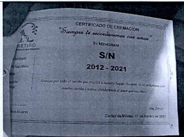
Fotografía 1 y 2. Inmueble motivo de denuncia y certificado de defunción.

En virtud de lo antes expuesto, esta Entidad considera procedente emitir la presente resolución, de conformidad con el artículo 27 fracción VI de la Ley Orgánica de esta Procuraduría, por imposibilidad material, en virtud de que dejaron de existir los hechos denunciados, al ya no encontrarse ejemplares caninos en el sitio motivo de la denuncia.