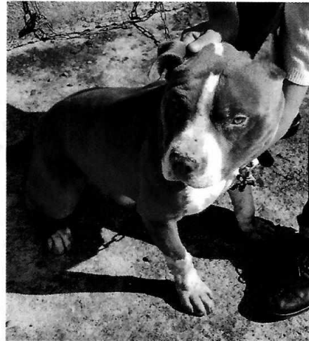
Fotografías 1 y 2. Se muestran ejemplares caninos motivo de denuncia.

Derivado de lo observado se realizaron las siguientes recomendaciones: