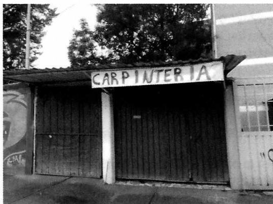
Fotografía 2. Se muestra fachada del inmueble donde se encontraba el establecimiento motivo de denuncia

Derivado de lo señalado, se concluye que los hechos denunciados dejaron de existir, toda vez que el establecimiento denominado “El negro de Acá”, ubicado en avenida Díaz Soto y Gama, edificio 2, agrupamiento 47, colonia Unidad Vicente Guerrero, Alcaldía Iztapalapa ya no se encuentra en funcionamiento.