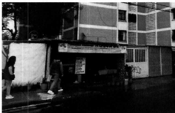
Fotografía 1. Se muestra fachada del establecimiento denominado "Antojitos mexicanos el negro de acá".

En este sentido, de las constancias que obran en el presente expediente, se desprende que personal de esta Subprocuraduría llevó a cabo una visita de reconocimiento de hechos, de acuerdo a lo establecido en el artículo 15 BIS 4 fracción IV de la Ley Orgánica de esta Entidad, diligencia durante la cual se constató el funcionamiento de un establecimiento con giro de antojería, de nombre comercial "Antojitos mexicanos el negro de acá" y se tuvo la atención de una persona de sexo masculino quien se ostentó como propietario del establecimiento en comento, al respecto, el ciudadano refirió que no contaba con alguna documental para poder acreditar el legal funcionamiento de la antojería, expresando también su negativa para regularizar dicho establecimiento. No obstante, se le entregó el citatorio correspondiente conminándolo a cumplir con lo señalado en la normatividad ambiental vigente aplicable.