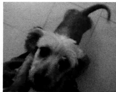
Figura 1-4. Ejemplares denunciados.

Es de resaltar que, en el Acuerdo de Admisión, que fue enviado por correo electrónico a la persona denunciante, se le hizo de conocimiento que contaba con un término de seis días hábiles para aportar las pruebas que estimara pertinentes en la investigación de los hechos, lo anterior conforme al artículo 90 del Reglamento de la Ley Orgánica de la Procuraduría Ambiental y del Ordenamiento Territorial de la Ciudad de México; sin embargo durante el procedimiento de investigación, no fueron proporcionados elementos de prueba que pudieran determinar incumplimiento a la normatividad en materia de bienestar animal.