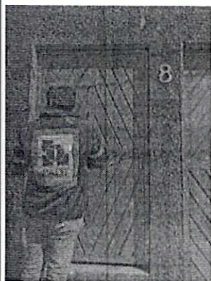
Imagen 1. Personal en el domicilio referido en la denuncia