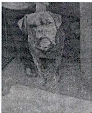
Imagen 2 -3. Ejemplar canino macho de raza bóxer "Lebrón"