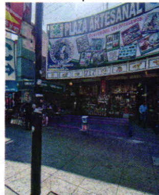
Figuras 3 y 4. Establecimiento mercantil denunciado.

En virtud de lo antes expuesto, esta Entidad considera procedente emitir la presente resolución, de conformidad con el artículo 27 fracción VII de la Ley Orgánica de esta Procuraduría, por el cumplimiento voluntario de las disposiciones jurídicas en materia de emisiones sonoras.