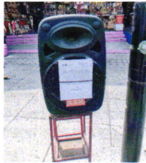
Figura 2. Bocina utilizada para la reproducción de música grabada.

Por lo antes referido, personal de esta Entidad realizó una nueva visita de reconocimiento de hechos, diligencia durante la cual, desde el espacio público, se observó que el equipo motivo de denuncia se encontraba desconectado, motivo por el cual no se constató la generación de emisiones sonoras que fueran susceptibles de medición acústica; no obstante se dejó oficio notificado mediante instructivo, en el cual se solicita adoptar voluntariamente medidas para prevenir, minimizar o evitar las molestias ocasionadas por el ruido.