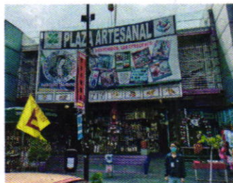
Figura 1. Establecimiento mercantil motivo de denuncia.

Por lo antes referido, mediante oficio PAOT-05-300/200-7886-2022 se hizo del conocimiento del propietario, encargado, apoderado y/o representante legal de dicha negociación mercantil que el artículo 29 fracción IX de la Ley de Cultura Cívica de la Ciudad de México, refiere lo siguiente (...) Son infracciones contra el entorno urbano de la Ciudad colocar en el espacio público enseres o cualquier elemento propio de cualquier establecimiento mercantil, sin la autorización correspondiente (...) , es este tenor, se le exhortó a cumplir de manera voluntaria con la legislación ambiental aplicable.