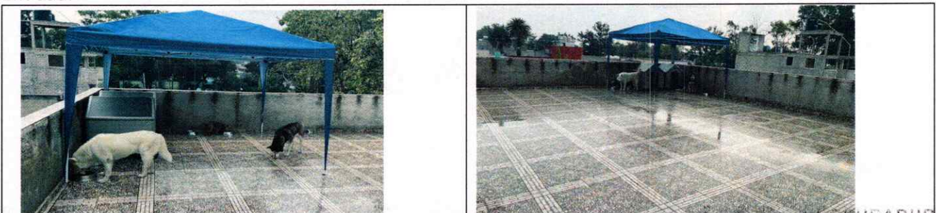
Fotografías 10 y 11.- Evidencia de las adecuaciones realizadas

En seguimiento de lo anterior, personal de esta Subprocuraduría tuvo contacto con la persona propietaria los ejemplares con la finalidad de dar seguimiento a las recomendaciones antes mencionadas, verificando que la persona encargada del cuidado de los caninos llevó a cabo las recomendaciones realizadas por personal de esta Entidad.