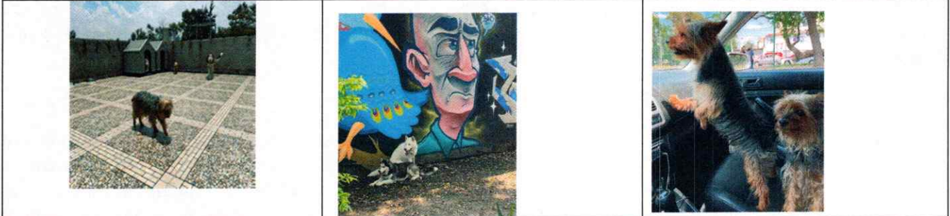
Fotografías 1-3.- Ejemplares caninos motivo de denuncia