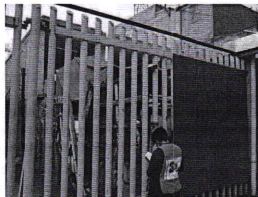
Figuras 1 y 2. Lugar de los hechos denunciados.

Es de resaltar que, con el propósito de contar con elementos adicionales respecto de los hechos denunciados, en el Acuerdo de Admisión, que fue enviado por correo electrónico a la persona denunciante, se le hizo de conocimiento que contaba con un término de seis días hábiles para aportar las pruebas que estimara pertinentes en la investigación de los hechos, lo anterior conforme al artículo 90 del Reglamento de la Ley Orgánica de la Procuraduría Ambiental y del Ordenamiento Territorial de la Ciudad de México; sin embargo durante el procedimiento de investigación, no fueron proporcionados elementos de prueba que pudieran determinar incumplimiento a la normatividad en materia de bienestar animal.