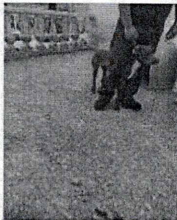
Imágenes 1 y 2. Ejemplares caninos Camila y Chester.