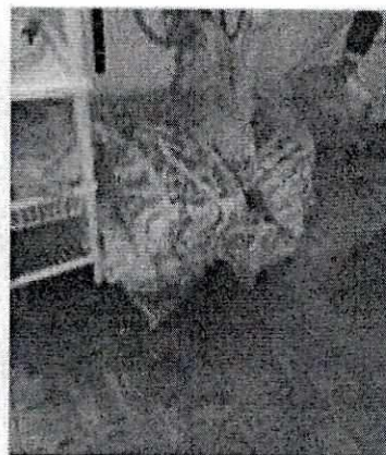
Imágenes 3 y 4. Cama al interior del domicilio así como bultos de croquetas.

En virtud de lo antes expuesto, esta Entidad considera procedente emitir la presente resolución, de conformidad con el artículo 27 fracción VI de la Ley Orgánica de esta Procuraduría, por imposibilidad legal, al no constatar irregularidades en materia de bienestar animal.