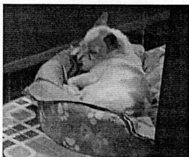
Figuras 1-4. Vista del ejemplar canino motivo de denuncia.