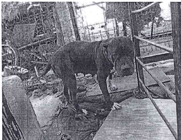
Fotografías 1 y 2. Vista del inmueble señalado en la denuncia y ejemplar canino motivo de investigación.

En seguimiento de lo anterior, personal de esta Subprocuraduría se comunicó vía llamada telefónica con la persona denunciante para informarle los hechos reconocidos durante la visita, llamada durante la cual se le informó a esta Entidad que el ejemplar ya no se encuentra en el lugar denunciado, toda vez que fue reubicado en otro domicilio, por lo que los hechos que motivaron su denuncia dejaron de existir.