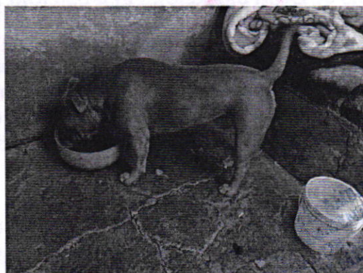
Figuras 1 y 2. Ejemplar canino motivo de denuncia.