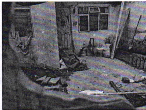
Figura 3. Vista del sitio referido en el escrito de denuncia.

En seguimiento de lo anterior, personal de esta Subprocuraduría llevó a cabo una nueva visita de reconocimiento de hechos con la finalidad de dar seguimiento a la observación antes mencionada; al respecto, la persona que atendió al personal actuante informó que el ejemplar canino que fue señalado en el escrito de la denuncia, ya no se encuentra en el inmueble, lo anterior toda vez que las personas que habitaban dicha vivienda dejaron de arrendar la misma, llevándose consigo a "Max". Cabe señalar que el personal de esta Subprocuraduría constató que efectivamente no había algún ejemplar con las características descritas en la denuncia al exterior del domicilio en cuestión.