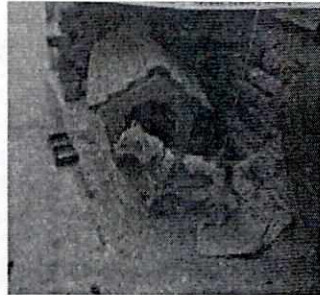
Imagen 2-4. Ejemplares caninos motivo de la denuncia