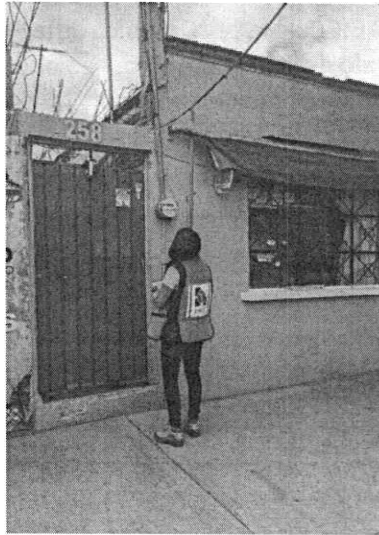
Imagen 1. Fachada del inmueble en comento.

En este sentido, de las constancias que obran en el presente expediente, se desprende que personal de esta Subprocuraduría llevó a cabo una visita de reconocimiento de hechos, de acuerdo a lo establecido en el artículo 15 BIS 4 fracción IV de la Ley Orgánica de esta Entidad, diligencia durante la cual dos personas habitantes del inmueble, refirieron que en el sitio no contaban con algún ejemplar canino, de igual manera, el personal actuante no constató olores ni ladridos provenientes del interior del domicilio que fueran indicativos de la presencia de algún can en el sitio.