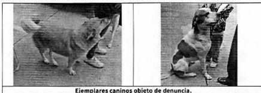
Ejemplares caninos objeto de denuncia.

Finalmente, se hizo del conocimiento de la persona responsable de los ejemplares caninos en comento, la legislación en materia de bienestar animal conminándola a su debido cumplimiento.