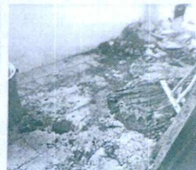
Imagen 3. Lugar de alojamiento del canino se observa el acumulo de heces y desechos