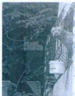
Imagen 2. Vista de la vía pública se observa al canino asomarse a la ventana