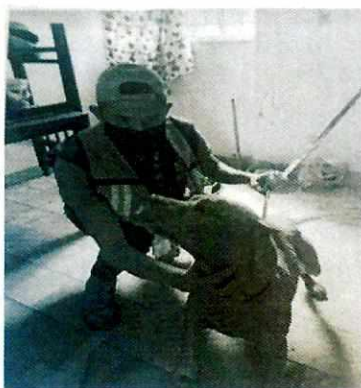
Imagen 4. Personal de esta entidad realizando el retiro del ejemplar del domicilio señalado

Derivado de lo observado por personal de esta Entidad, la persona responsable del ejemplar, lo entregó de manera voluntaria al personal de esta Subprocuraduría, a efecto de que le sean brindados los cuidados de bienestar necesarios. Por lo cual la PAOT hizo entrega del ejemplar a una persona adoptante, quien se comprometió a proporcionar las condiciones adecuadas de bienestar.