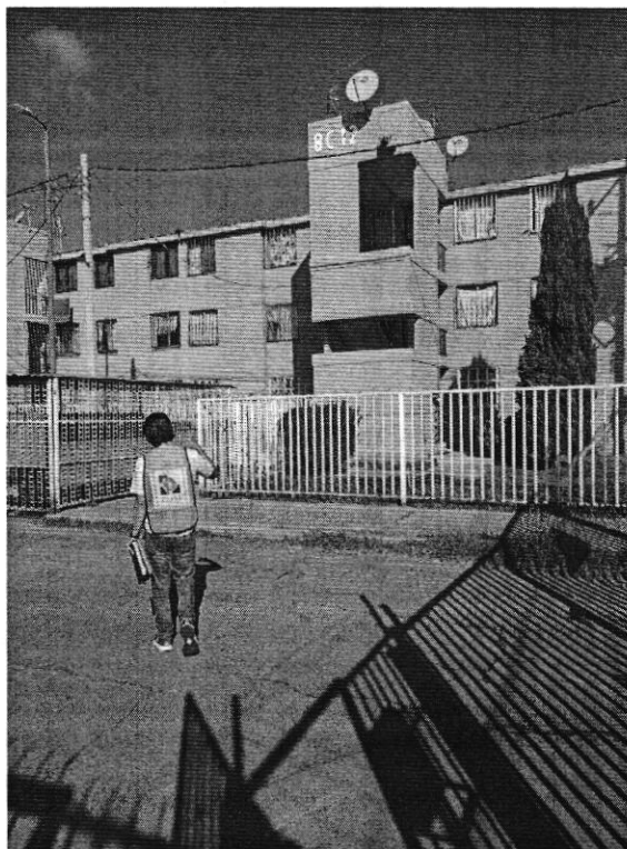
Fotografía 1. Sitio referido en el escrito de denuncia.