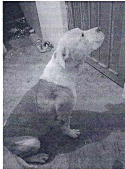
Fotografías.- Ejemplares caninos motivo de denuncia.