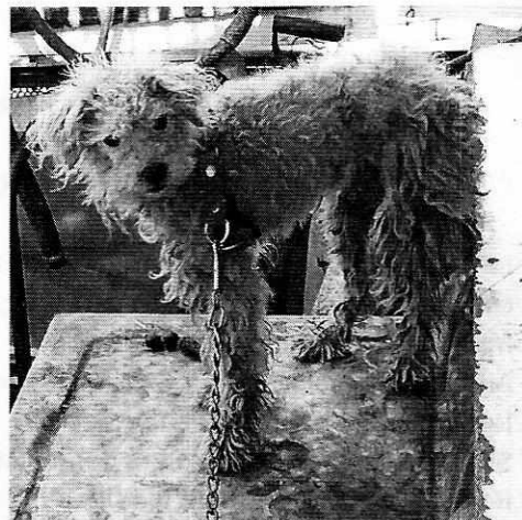
Fotografía 1. Se muestra la condición en la cual se encontraba el ejemplar canino durante el reconocimiento de hechos.