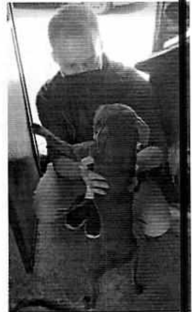
Ejemplar canino motivo de denuncia

A decir de su responsable, el ejemplar canino en comento: