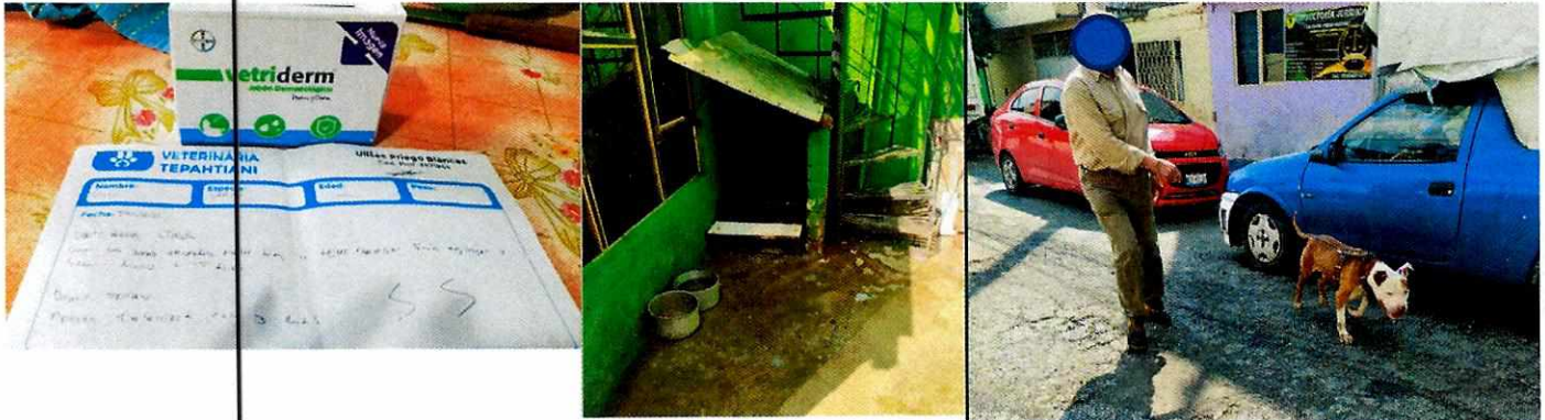
Fotografía 3-5. Receta médica, alojamiento limpio y paseos del canino.

encargada del cuidado de los caninos realizó llevó a cabo las recomendaciones realizadas por personal de esta Entidad.