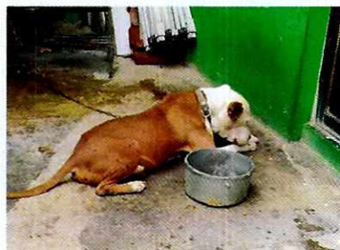
Fotografía 1-2. Ejemplar canino motivo de denuncia y lugar de alojamiento

En seguimiento de lo anterior, personal de esta Subprocuraduría tuvo contacto con el responsable del canino con la finalidad de dar seguimiento a las recomendaciones antes mencionadas, constatando que la persona