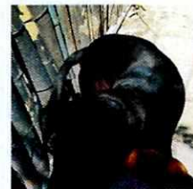
Fotografía 1-5. Ejemplares caninos motivo de denuncia.

Es de resaltar que, en el Acuerdo de Admisión, que fue enviado por correo electrónico a la persona denunciante se le hizo de conocimiento que contaba con un término de seis días hábiles para aportar las pruebas que estimara pertinentes en la investigación de los hechos, lo anterior conforme al artículo 90 del Reglamento de la Ley Orgánica de la Procuraduría Ambiental y del Ordenamiento Territorial de la Ciudad de México; sin embargo durante el procedimiento de investigación, no fueron proporcionados elementos de prueba que pudieran determinar incumplimiento a la normatividad en materia de bienestar animal.