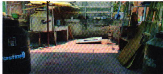
Figura 1-3. Lugar de los hechos denunciados.

En seguimiento de lo anterior, personal de esta Subprocuraduría informó a la persona denunciante que durante visita de reconocimiento de hechos no se constató la presencia del ejemplar canino en el sitio señalado en su denuncia, por lo que los hechos que motivaron su denuncia dejaron de existir.