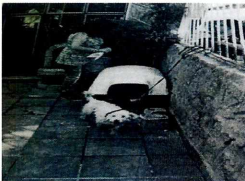
Imagen 1. Se observa al ejemplar canino macho "Copo" amarrado con correa corta