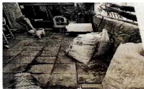
Imagen 4. Propietario realizando limpieza del alojamiento, ya que su domicilio realizaba trabajos de remodelación

En virtud de lo antes expuesto, esta Entidad considera procedente emitir la presente resolución, de conformidad con el artículo 27 fracción VII de la Ley Orgánica de esta Procuraduría, por el cumplimiento voluntario de las disposiciones jurídicas en materia de bienestar animal.