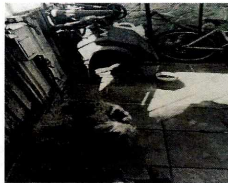
Imagen 2. Interacción entre los dos caninos es agresiva

En seguimiento de lo anterior, personal de esta Subprocuraduría llevó a cabo una nueva visita de reconocimiento de hechos con la finalidad de dar seguimiento a las recomendaciones antes mencionadas, constatando que la persona encargada del cuidado de los caninos realizó lo que se recomendó por personal de esta Entidad.